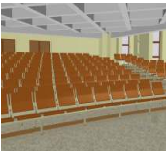
3. Aula – vedere interioară