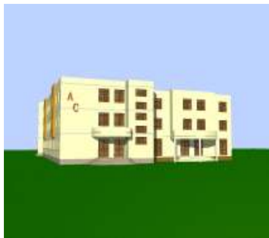
4. Clădirea centrală – intrare laterală