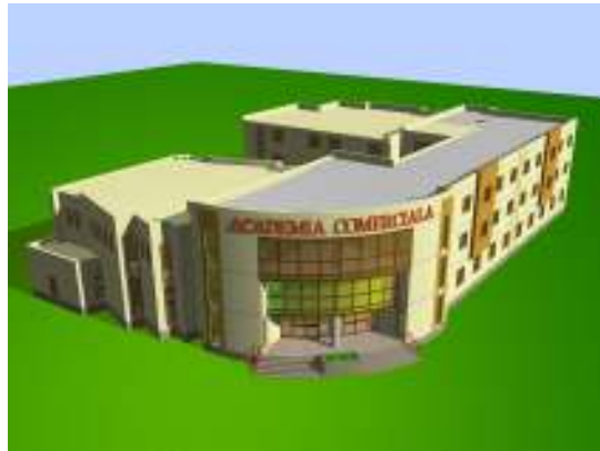
2. Clădirea centrală – vedere