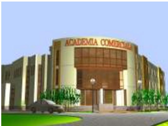
1. Fațada – intrarea principală

E-mail: academiacomerciala@yahoo.com ; www.academiacomerciala.ro